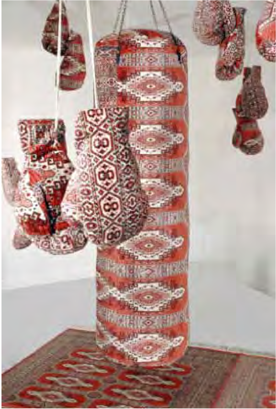
A bas les cieux - 2008

C'est dans cet espace de réflexion que mon travail plastique prend source. Il est pour moi le moyen de jeter un pont entre l'art et le vivant plutôt que d'en accentuer la rupture. Les rapports entre le corps et l'esprit sont le prolongement de mes préoccupations. Ce corps qui se veut de plus en plus libéré reste en fait prisonnier d'une société qui cherche à masquer, occulter, les réalités telles que la souffrance, la maladie, la mort.