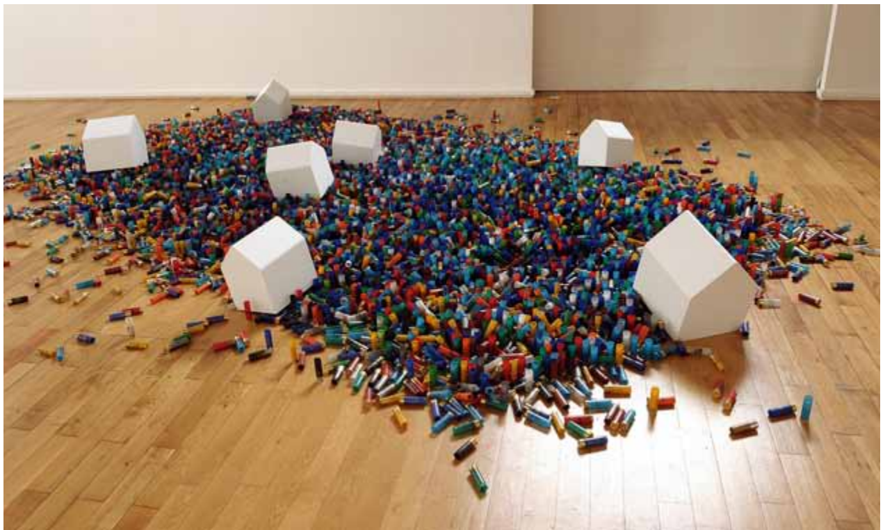
L'odeur des mots - 2012