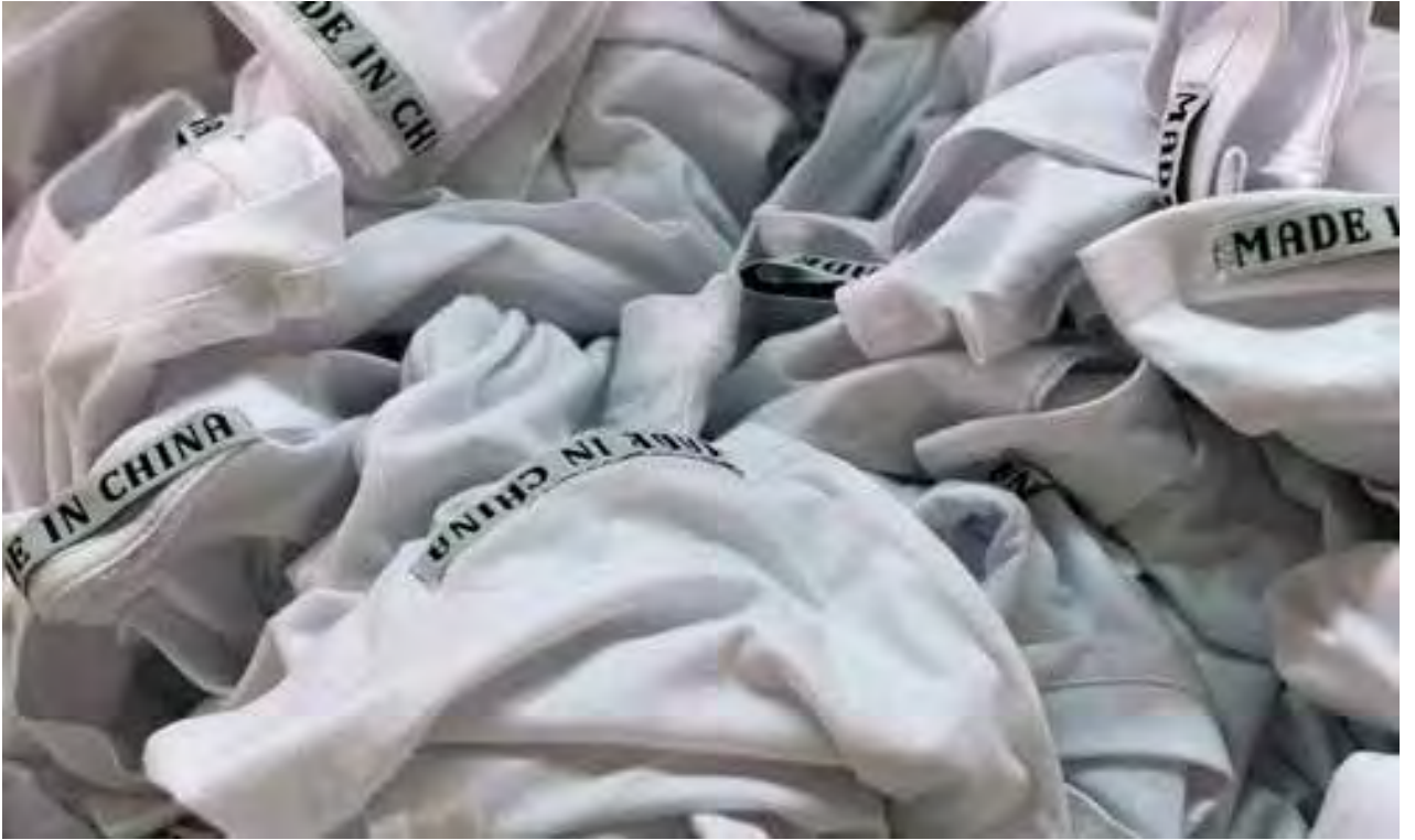
Made in China - 2012