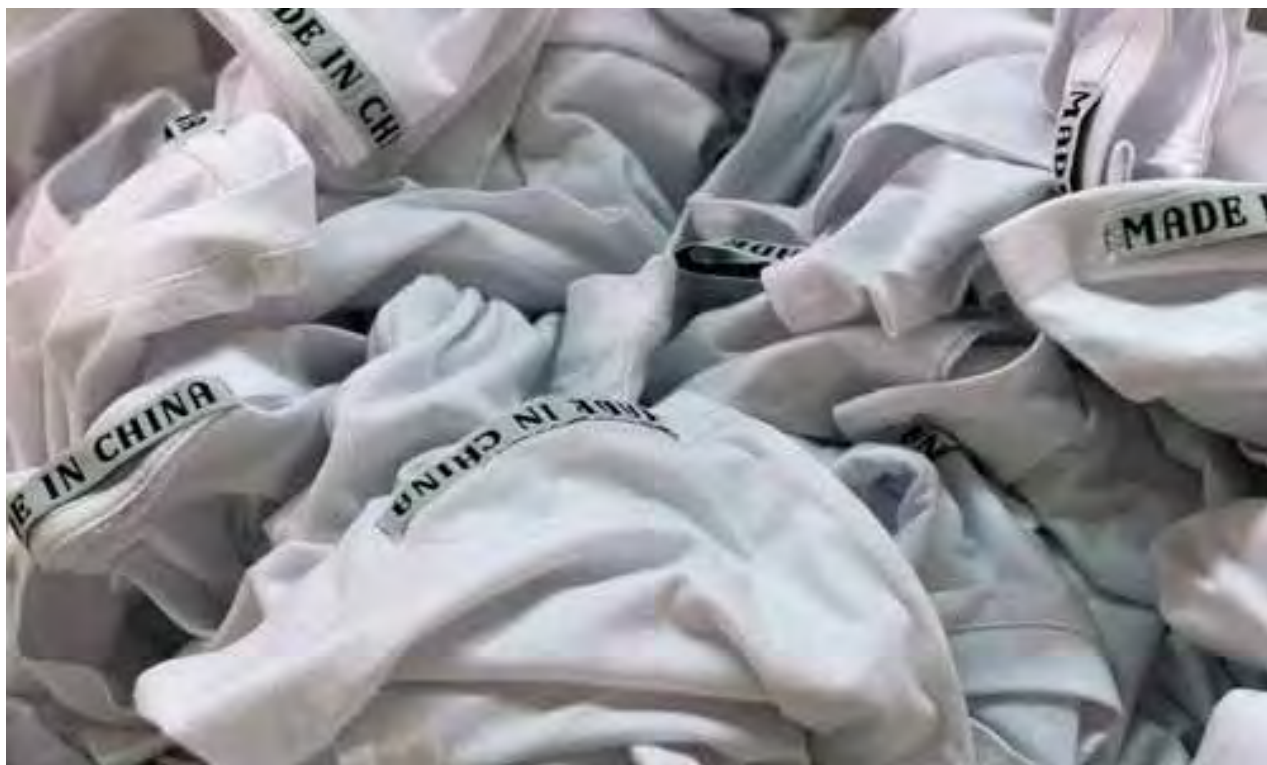
Made in China - 2012