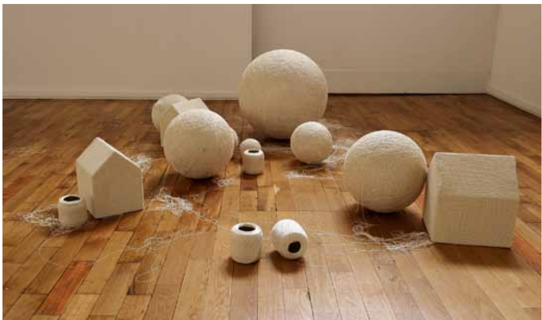
A demeure, je meurs - 2012

Dans notre société de consommation, l'objet a su s'imposer et prendre une place essentielle. Il sert d'intermédiaire entre les individus ; il est à la fois une retraduction du langage et l'élément qui réinterroge l'individu face à lui-même et face aux autres.